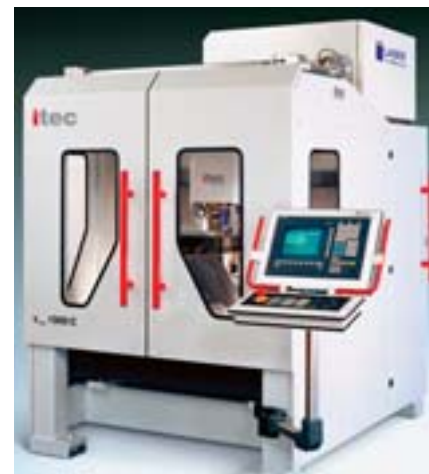
Bild 5: Laserbearbeitungsmaschine mit FPA-Kompaktantrieb

Die Harmonic Drive-Servoregelungen bieten Einachstechnik mit integriertem Power Supply und ermöglichen eine digitale Strom- und Drehzahlregelung. Bei der Positionierung können maximal 15 Positionen gespeichert werden. Pulse-Folge-Betrieb, Auto-Tuning Drehzahlregelkreis und SPS-Funktionen sind weitere Merkmale.