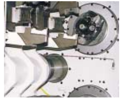
Bild 2: Hohlwellenantriebe im Einsatz in Teiltischen zur Tieflochbohrung von Kurbelwellen

Bild 1: 3D-Darstellung des Hohlwellenantriebs mit hoher Leistung auf engem Raum