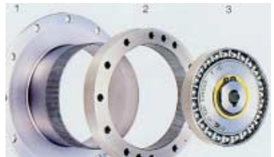
Bild 4: Der integrierte Getriebeeinbausatz (1: Flexspline, 2: Circular Spline, 3: Wave Generator)