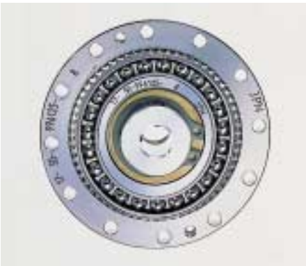
3: Präzisionsgetriebe „HFUC Super Mini“ mit kleinerer Übersetzung dank optimierter Verzahnung

te Oberfläche am Wave-Generator-Lager gebildet, welche zu einer höheren Tragfähigkeit sowie zu einem verstärkten Widerstand gegen kontaminierten Schmierstoff führt.