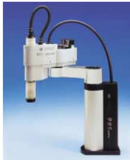
5: Scara-Roboter der Firma Robert Bosch GmbH für Reinräume, ausgestattet mit Harmonic-Drive-Getrieben

Den Entwicklungsingenieuren von Harmonic Drive ist es nun gelungen, anhand einer dreidimensionalen Simulation des Zahneingriffs ein neues Zahnprofil mit reduzierter Zahnhöhe zu entwerfen. Damit kann die stark ausgeprägte Ellipsenform wieder begrenzt werden. Weiterhin ist die Flexspline-Wandstärke anhand von FEM-Analysen derart optimiert worden, dass die Biegespannungen minimiert werden können. Last but not least, wird bei diesen neuen Getrieben des Namens „HFUC Super Mini“ (Bild 3) die patentierte IH-Verzahnung angewendet. Wie schon in Teil I beschrieben, ist der Anteil tragender Zähne wesentlich größer als bei Getrieben mit herkömmlicher Evolventenverzahnung. Bis zu 30%