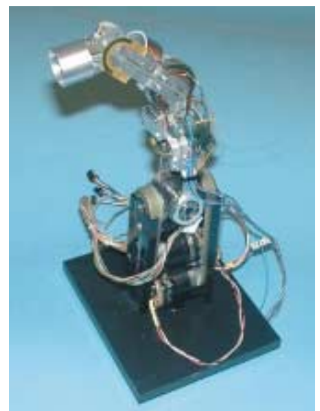
6: Skelett eines Fingers für die künstliche Hand eines Leichtbauroboters der Firma DLR, ausgestattet mit Harmonic-Drive-Getrieben

Die nennenswerten Vorteile der neuen Baureihe „CSG Super Harmonic Drive“ sind natürlich für die Hersteller von Industrierobotern besonders interessant. Die Merkmale der neuen Baureihe sind auch bei anderen Getriebebauformen verfügbar, und HFUS-Units (siehe auch Teil I) mit der neuen Wave-Generator-Ausführung sind schon in neuen Scara-Robotern der Firma Robert Bosch GmbH im Einsatz. Bild 5 zeigt die neueste Ausführung dieser Roboterbaureihe, nämlich eine Sonderausführung für den Einsatz im Reinräumen. Die neue Ausführung kann bis zur Reinraumklasse 1 eingesetzt werden. Dafür sind alle rotierenden Bauteile und Antriebs Elemente völlig gekapselt, und die Bewegungsabläufe des Roboters wurden modifiziert, um die Strömungsverhältnisse im Reinraum so wenig