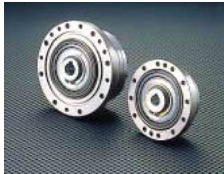
1: Präzisionsgetriebe „CSG Super Harmonic Drive“ mit besserem Drehmoment und längerer Lebensdauer

Sowohl bei Industrierobotern als auch bei Servicerobotern wird zur Zeit versucht, das Verhältnis zwischen Eigengewicht und Traglast zu minimieren. Diese Entwicklung war auf der Hannover-Messe 2000 deutlich